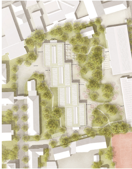
Lageplan Neubau Josefstraße

Die Stadt Bielefeld beabsichtigt den Neubau und die Neuordnung der vierzügigen Realschule Luisenschule, welche heute auf zwei Standorte verteilt ist. Zukünftig soll die Schülerschaft der Luisenschule asymmetrisch geteilt werden. Die Jahrgänge 9 + 10 sollen am Standort Paulusstraße beschult werden, die Jahrgänge 5-8 auf dem Schulgelände Josefstraße. Der Standort Josefstraße (Aufgabe dieses Wettbewerbs) soll einen Neubau erhalten, in dem das Raumprogramm für die Jahrgänge 5-8 der Luisenschule sowie OGS-Teilflächen der benachbarten Grundschule Josef und Flächen für eine Quartiersnutzung untergebracht werden sollen. Die Bestandsgebäude 10, 30 + 40, 50 + 51 sind dafür zu überplanen und sukzessive abzubauen, das Gebäude 95 bleibt erhalten und bedarf einer Neuordnungsplanung. Die Freianlagen sind neu zu planen. Der Auslober beabsichtigt die BNB-Zertifizierung „Silber“ für den Schulneubau.