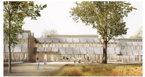
Blick vom Quartiersplatz auf den Eingang.