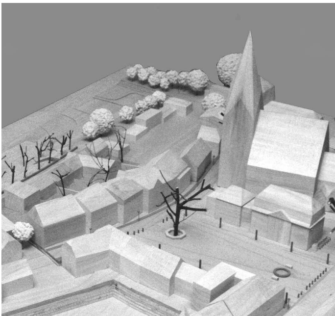
2. Preis: Gruppe Planwerk, Berlin