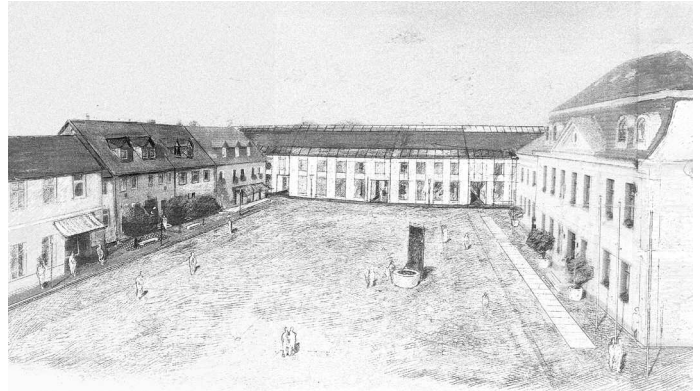
1. Preis: WES & Partner, Hamburg