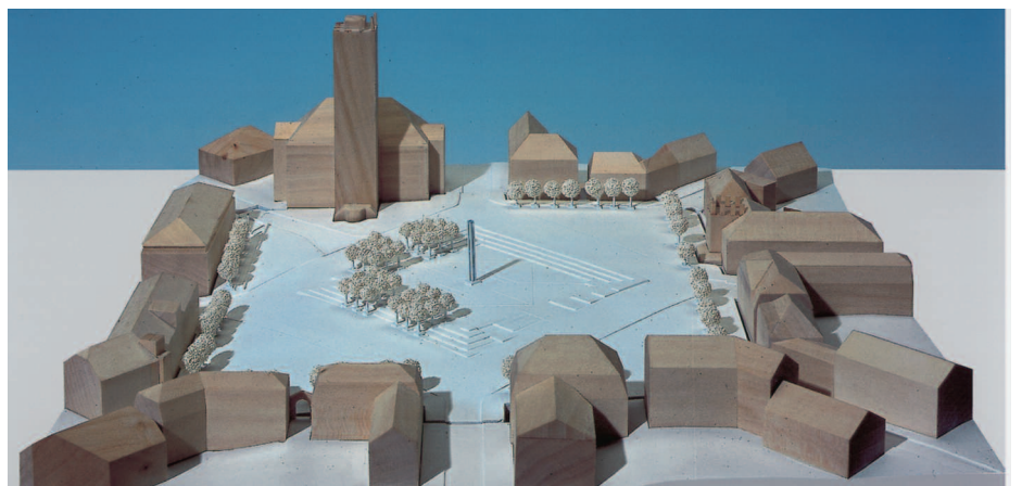
3. Preis: Arge Hasselbach + Lobst · Fleege + Oeser, Berlin