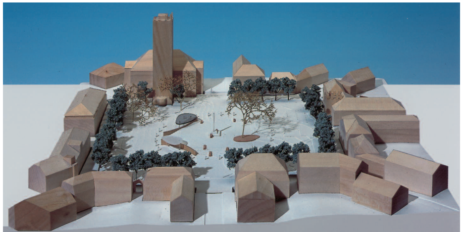
Ankauf: Planungsbüro Wittig, Weimar