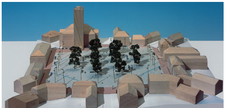
2. Preis: Arge Adam + Partner, Potsdam · Terraform, Berlin