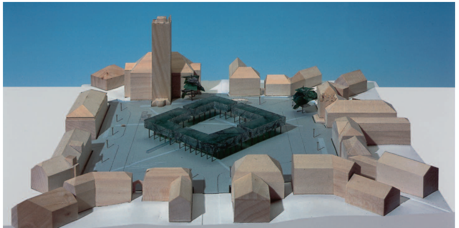
5. Preis: Kantor Freiraumplanung, Hamburg