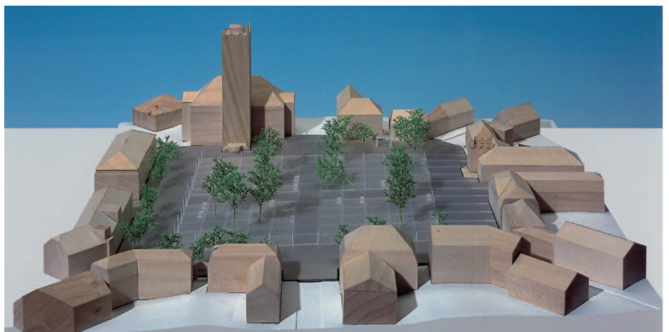
Ankauf: Lorber + Paul, Köln