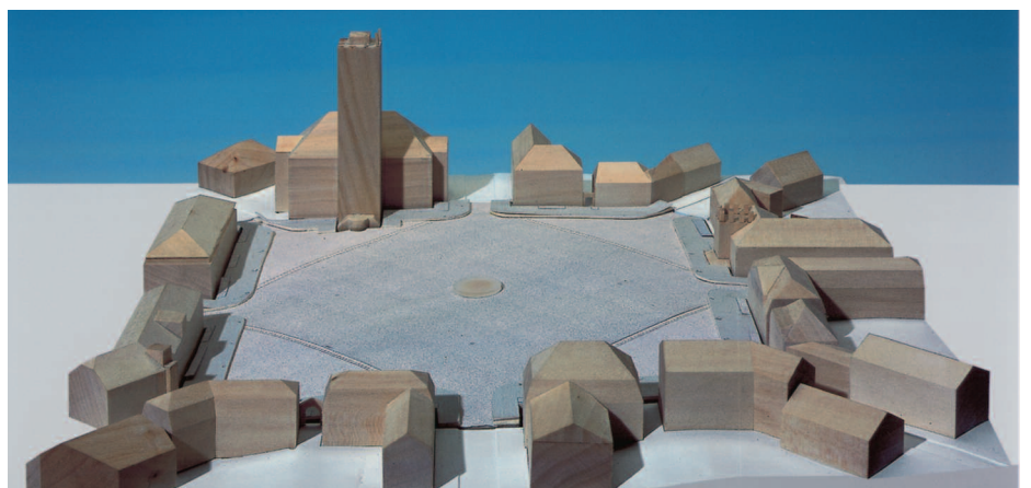
4. Preis: ST raum a. Landschaftsarchitekten, Berlin