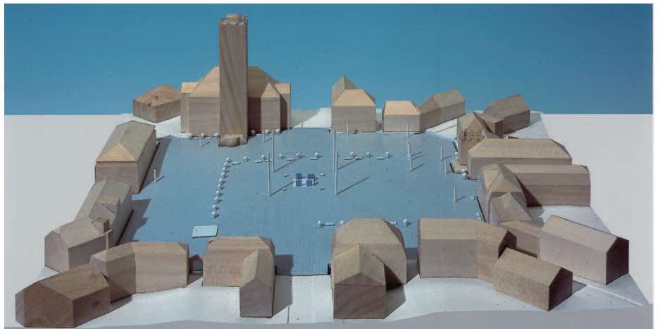
Ankauf: Atelier Schreckenbergs + Partner, Rostock