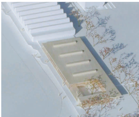
2. Preis: Harter und Kanzler, Waldkirch

Der Olympiastützpunkt Freiburg-Schwarzwald wurde 1988 für die Sportarten Skilauf, Radsport, Ringen, Leichtathletik und Kunstturnen eingerichtet. Um in Freiburg eine kontinuierliche Betreuung der Athleten zu ermöglichen soll auf dem Gelände der Universitätsportanlage durch die Integration des Bundesstützpunktes und Landesleistungszentrums für Ringen in den Gesamtkomplex des Funktionsgebäudes eine Sport- und Gymnastikhalle mit zusätzlichen Nutzungsmöglichkeiten entstehen. Die Schwerpunkte der räumlichen Ausstattung liegen in Räumen für das Kraft- und Konditionstraining, der trainingsbegleitende Regeneration und sportphysiotherapeutischen, trainingswissenschaftlichen und leistungsdiagnostischen Betreuung der Athleten.